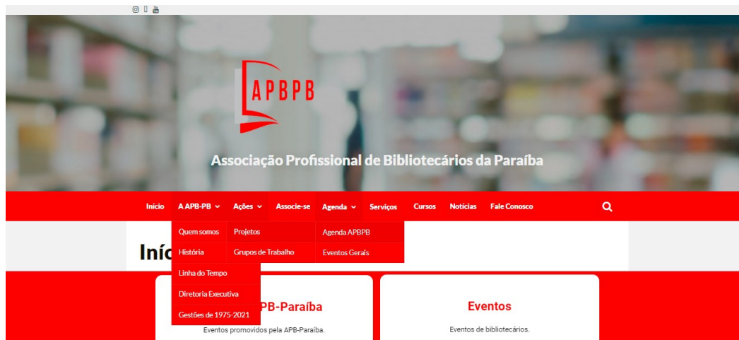
Figura 2 – Layout das páginas e subpáginas do Site APB-PB

alimentação de matérias. Além disso, há o desenvolvimento do layout que melhor se adequar a imagem que a Associação pretende transmitir, trazendo uma estrutura de páginas e subpáginas, segundo a Figura 1: