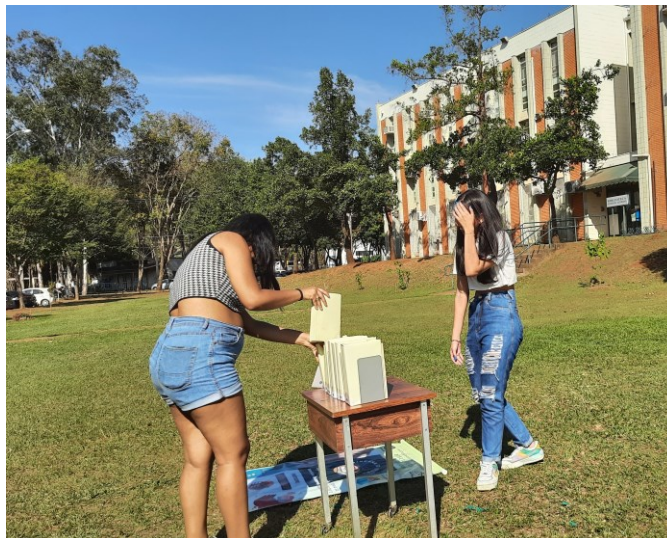
Figura 5 – Visitantes organizando o “livro fake” classificado no “acervo simulado”.