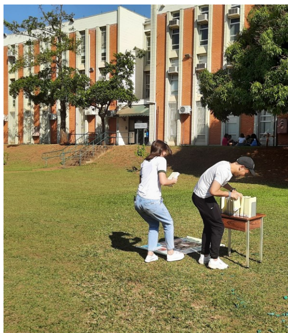
Figura 6 – Visitantes organizando o “livro fake” classificado no “acervo simulado”.