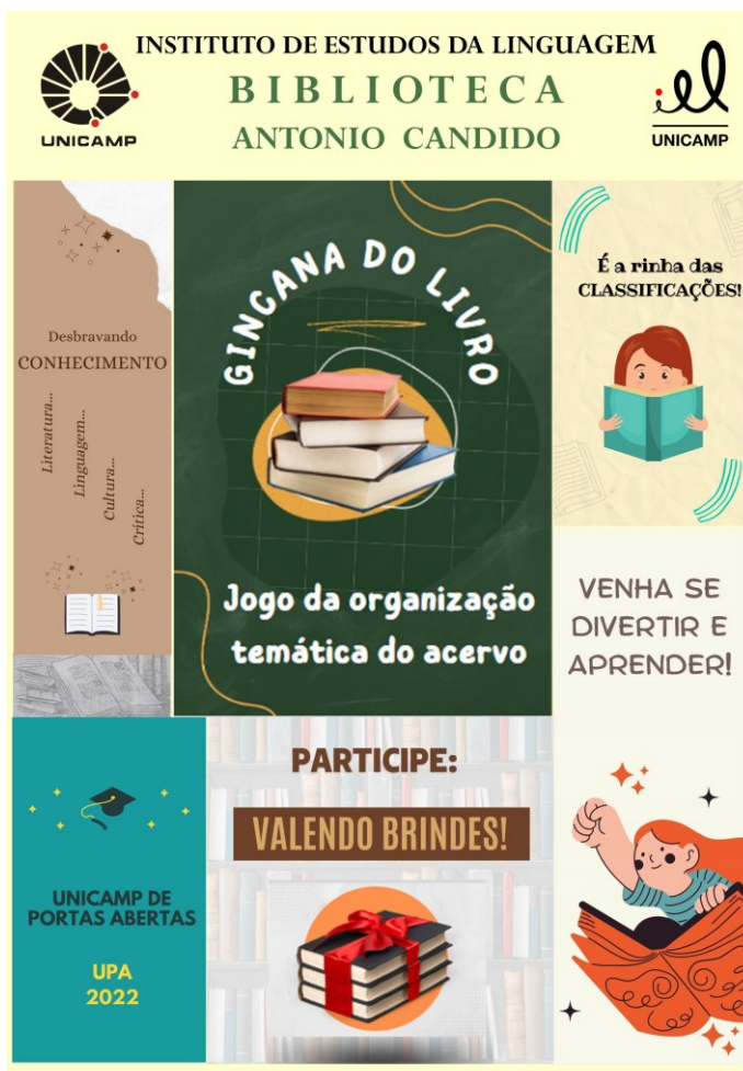
Figura 1 – Pôster utilizado na gincana do livro realizada na UPA 2022

Descrição: Arte gráfica do pôster utilizado na gincana do livro realizada no evento Unicamp de Portas Abertas 2022.