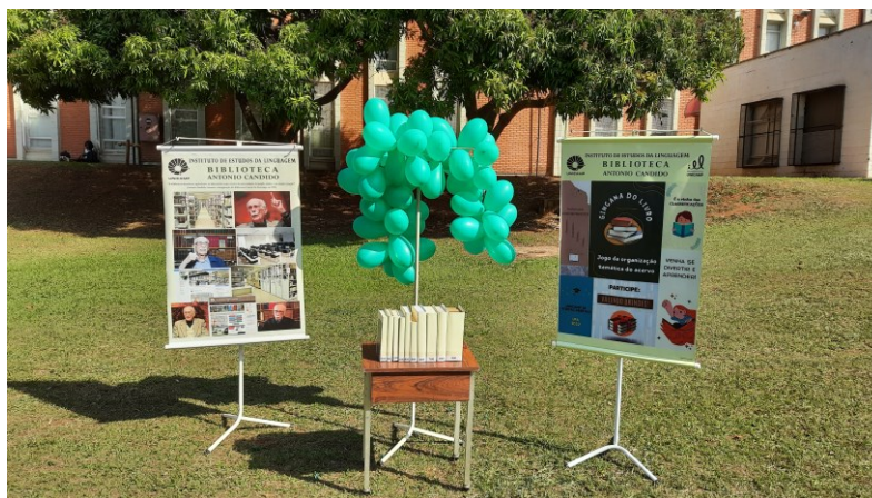
Figura 7 – Simulação de acervo com classificações de 0XX a 9XX.