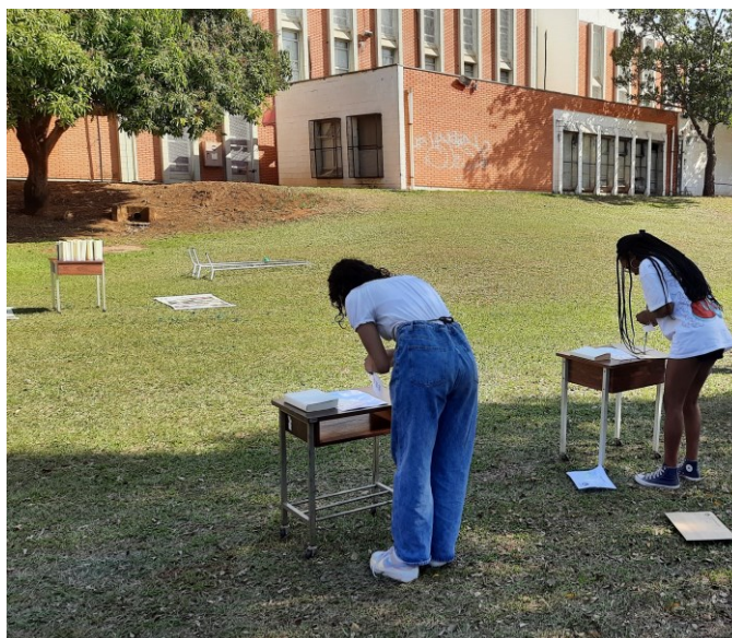
Figura 4 – Visitantes identificando classe decimal e colando etiqueta no “livro fake”.