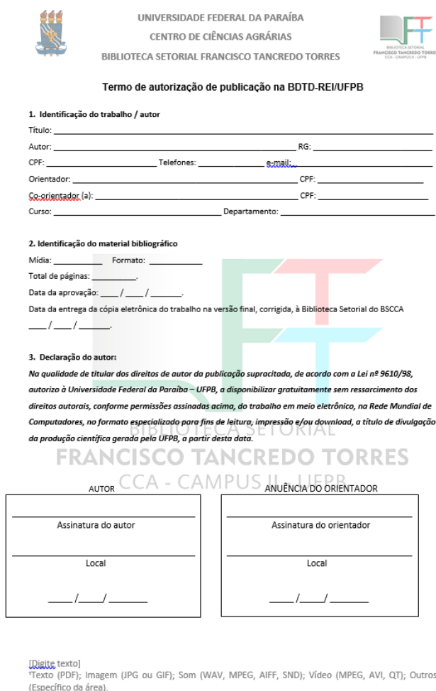
Figura 2 – Termo de autorização

do trabalho no Repositório Institucional. Esse documento leva em consideração os preceitos da lei nº 9610/98, sobre os direitos autorais.