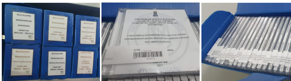
Figura 1 – Imagem das caixas de arquivamento do material e dos CD's

Os trabalhos entregues e os que estão no acervo são conferidos quanto aos dados de registros (número de patrimônio, termos de autorização, carimbos, catálogo do repositório institucional e catálogo OPAC), para serem inseridos na planilha de verificação, colocando tudo em conformidade com o padrão determinado.