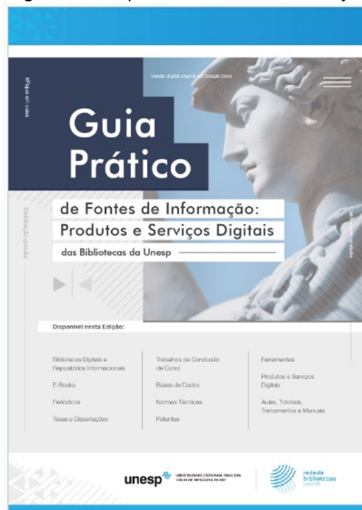
Figura 1 – Guia prático de fontes de informação