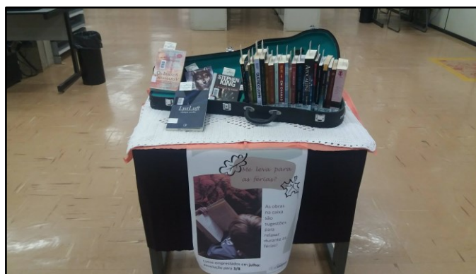
Figura 2 - Foto da primeira exposição

Os livros foram dispostos em uma caixa de violino, sobre uma mesa coberta com uma toalha e um cartaz com a pergunta "Me leva para as férias?", sugerindo aos estudantes a levar os livros consigo durante o período de descanso.