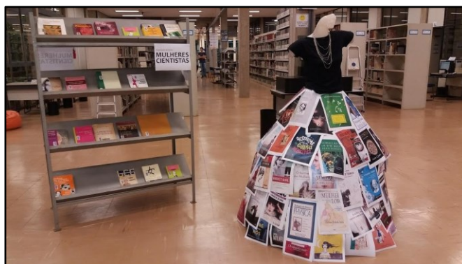
Figura 1 - Exposição Mulheres Cientistas

Para planejamento e seleção dos temas, a cada semestre os autores verificam as datas comemorativas e eventos para as exposições, são selecionados temas pertinentes à comunidade usuária. Também podem ser considerados aniversários de autores de literatura, ciência ou áreas abrangidas no câmpus. As datas são adicionadas a uma agenda online criada para o projeto. Aliados às obras são disponibilizados cartazes e elementos decorativos que traduzam o assunto e tornem a exposição atrativa (Lanz, 2012). Já foram usadas bandeiras, caixas revestidas, manequim, mobília, papéis, tapetes e tecidos.