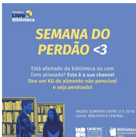
Figura 1 - Post Instagram Semana do Perdão 2019

Amigos do Hospital Universitário (AAHU) da Universidade Federal de Santa Catarina (UFSC).