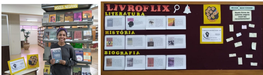
Figura 4 - Consciência negra

A iniciativa "Leia mulheres" é realizada na Biblioteca Central desde 2020. À época, em matéria elaborada pela comunicação institucional, a ação da biblioteca foi citada "Como uma forma de homenagear as mulheres, a Biblioteca Central da UFJF organizou uma exposição de livros escritos por mulheres, tendo como objetivo principal divulgar as obras das autoras" (UFJF, 2020).