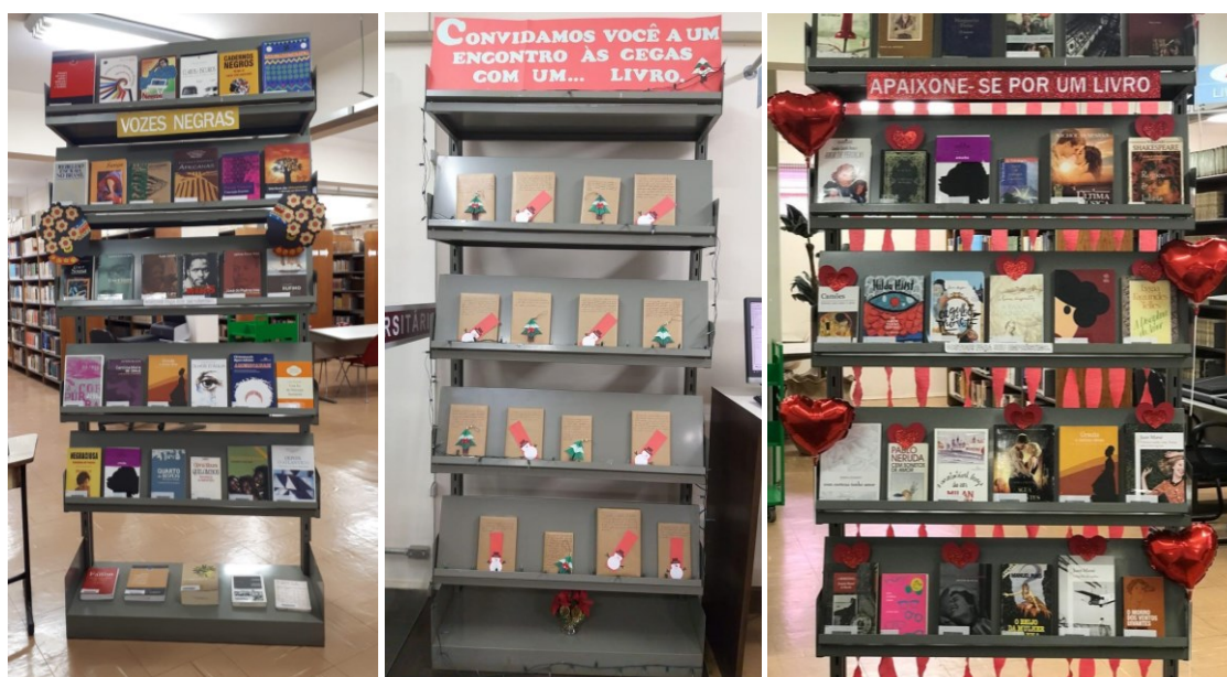
Figura 3 - Estantes temáticas

disponibilizar obras de datas comemorativas ou de temática em voga. Assim como o "Livroflix", realizou-se um levantamento de possíveis datas, incluindo feriados, datas comerciais, aniversários de nascimento e morte de autores, além de datas relativas à biblioteca, educação e comemorações de profissões. A cada mês, é escolhido um tema para o mês seguinte e, a partir dessa escolha, é conduzida uma pesquisa no acervo da Biblioteca Central para identificar obras relacionadas de alguma maneira com o tópico selecionado. Com base na lista das obras, estas são recolhidas para compor a estante, enquanto a equipe elabora e confecciona a parte decorativa.