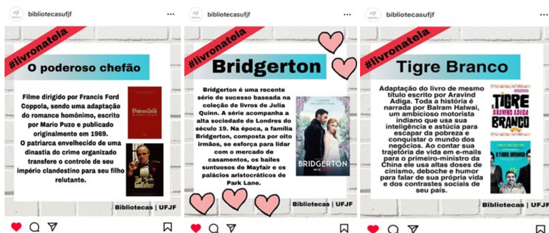
Figura 2 - Livro na tela

A primeira ação desenvolvida na mídia social foi a divulgação de obras literárias que inspiraram produções para o cinema, televisão ou séries, intitulada 'Livro na tela'. A cada sexta-feira, era publicado um layout padrão com a obra literária e sua adaptação, acompanhado de um breve resumo. No entanto, essas obras não necessariamente faziam parte do acervo, pois dadas as circunstâncias, não era possível emprestá-las presencialmente.