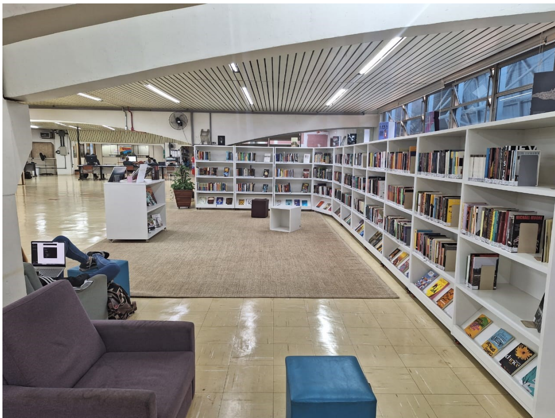
Figura 4: Espaço BIBCOM 1 - Acervo Multicultural