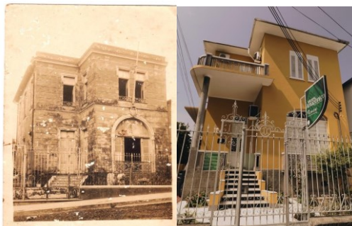
Figura 1 – Museu Amazônico

suas culturas. O Museu foi criado em 1975, implementado somente no ano de 1989 e encontra-se sediado no centro histórico da cidade de Manaus.