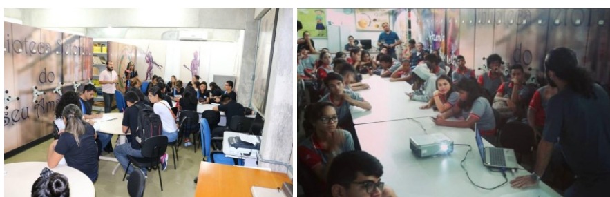
Figura 5 – Visitação de estudantes de escola pública

Descrição: Fotografia de alunos do Ensino Fundamental em atividades na biblioteca