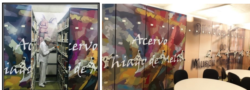
Figura 2 – Acervos da BSMA

O Museu Amazônico possui um vasto acervo documental, etnográfico e arqueológico. Organiza e promove exposições temporárias e de longa duração, além de disponibilizar seu espaço para mostras individuais artísticas e programações que se identifiquem e traduzam o seu perfil de atuação perante a sociedade.