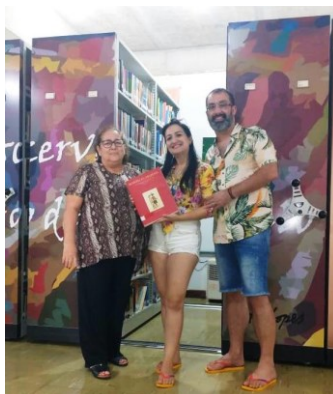
Figura 3 – Visitação de turistas

Por estar localizada no centro histórico da cidade de Manaus e junto ao Museu Amazônico, a BSMA se constitui como passagem obrigatória de interesse aos turistas e visitantes em geral. Além do interesse de conhecer o patrimônio local, os turistas recorrem à biblioteca de forma espontânea para obter informações turísticas, então a equipe apresenta materiais informacionais contendo os principais atrativos turísticos da região amazônica.