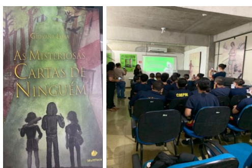
Figura 6 – Lançamento de livro

Os pesquisadores, de modo geral utilizam os serviços e produtos da BSMA em busca de fonte primária de informação para subsidiar suas pesquisas, bem como fortalecer ou confirmar seus dados já coletados, já que o acervo possui obras que possibilitam um conhecimento aprofundado sobre temas relacionados à Amazônia.