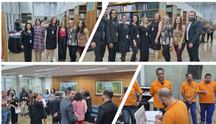
Figura 3 – Inauguração das novas instalações da Biblioteca do TRF3 em agosto de 2023

A preparação do novo espaço contou com o apoio e a colaboração de muitas equipes, em especial os funcionários terceirizados de apoio braçal, da manutenção e da limpeza, pela boa vontade e dedicação demonstrados. As novas instalações foram abertas ao público interno e externo no início de junho de 2023, ainda com alguns ajustes pendentes. A Presidente do TRF3 à época, Desembargadora Federal Marisa Santos, decidiu realizar uma inauguração oficial da Biblioteca em 10 de agosto de 2023, solenidade noticiada no site e redes sociais do Tribunal (Fig.3).