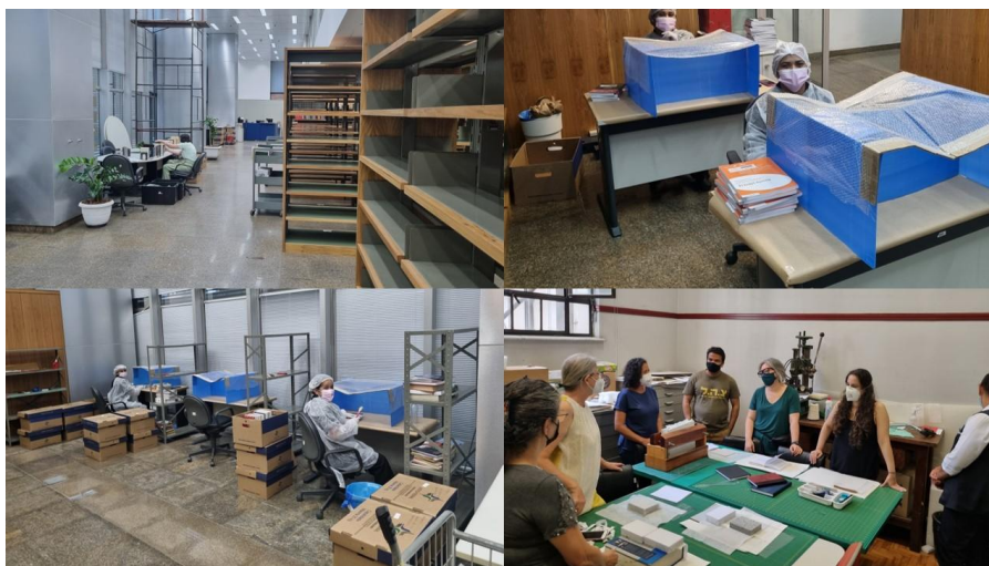
Figura 2 – Higienização do acervo, revisão e recolocação nas estantes no novo espaço

técnica à bicentenária Biblioteca da Faculdade de Direito da USP para orientações relativas ao processo de higienização (Fig.2).