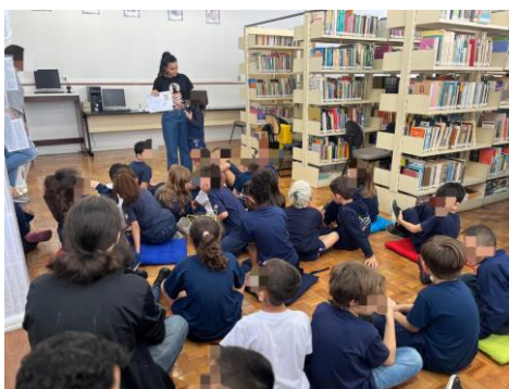
Figura 3 – Visita guiada

A terceira etapa correspondeu à execução e à mediação da ação durante a Feira Literária (FLIJ), momento em que as turmas participaram de visitas guiadas ao novo espaço e da redação das cartas. Durante as visitas, a equipe pôde registrar e vivenciar as impressões de alunos e professores, evidenciando um processo rico em trocas, surpresas e entusiasmo com o novo ambiente. Observou-se uma valorização da comunidade escolar em relação à nova organização do espaço. Os professores destacaram o potencial pedagógico da nova disposição do mobiliário e a adequação estética para o público infantil. Da mesma forma, os estudantes expressaram satisfação ao perceberem que o ambiente havia sido planejado para oferecer-lhes maior conforto e protagonismo, viabilizando a realização de diversas atividades naquele ambiente. Para o envio das cartas elaboradas pelos alunos na visita, a equipe da biblioteca, atuando na figura de agente postal, realizou a mediação de todo o processo, o que incluiu uma curadoria ética do conteúdo das correspondências, de modo a assegurar o respeito mútuo, o acolhimento e a qualidade das interações. (Figura 3)