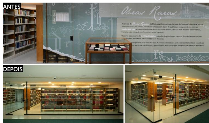
Figura 3 – Exterior da Sala de Obras Raras