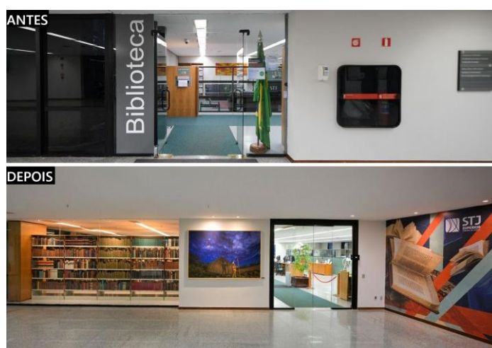
Figura 1 – Fachada da Biblioteca