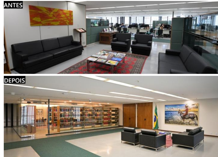
Figura 5 – Salão de Leitura