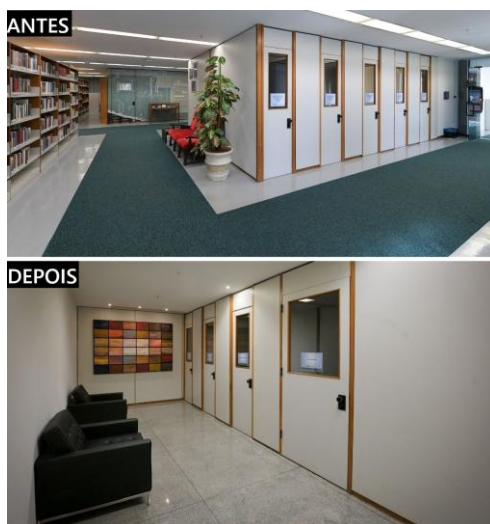
Figura 4 – Cabine de estudo individual