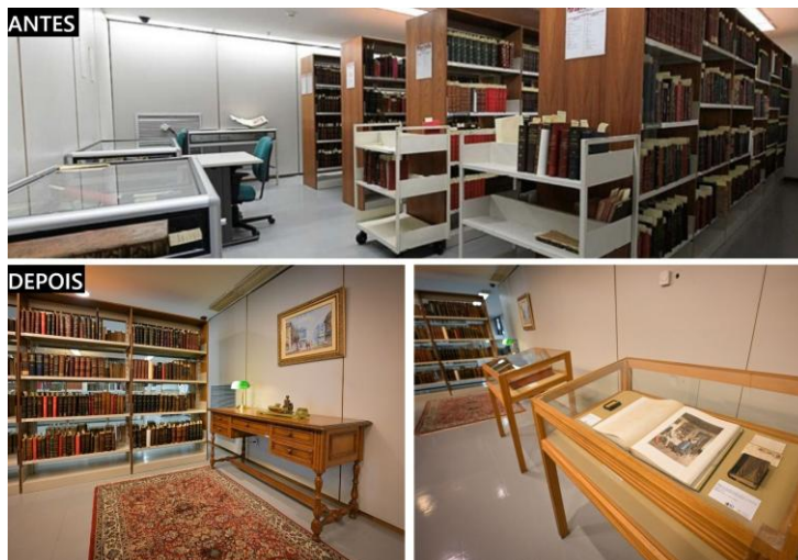
Figura 2 – Interior da Sala de Obras Raras