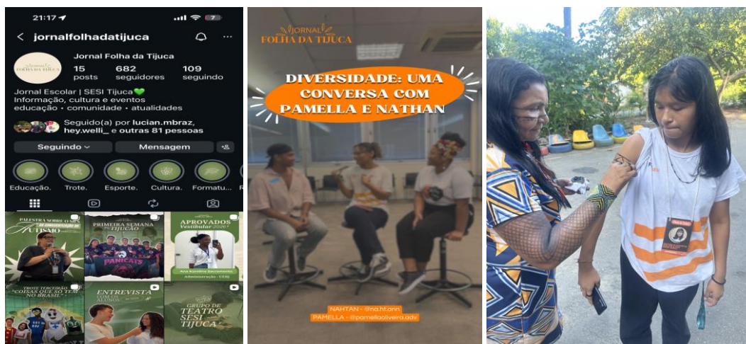
Figura 1 – 3 imagens: perfil do Instagram + post sobre diversidade e visitação a Aldeia Maracanã

mídia e passam a participar ativamente da construção de narrativas, ampliando a percepção sobre linguagem, credibilidade e responsabilidade editorial. Jenkins (2009) observa que a cultura da convergência altera as relações entre produtores e consumidores de mídia, permitindo formas mais participativas de criação e compartilhamento de conteúdo.