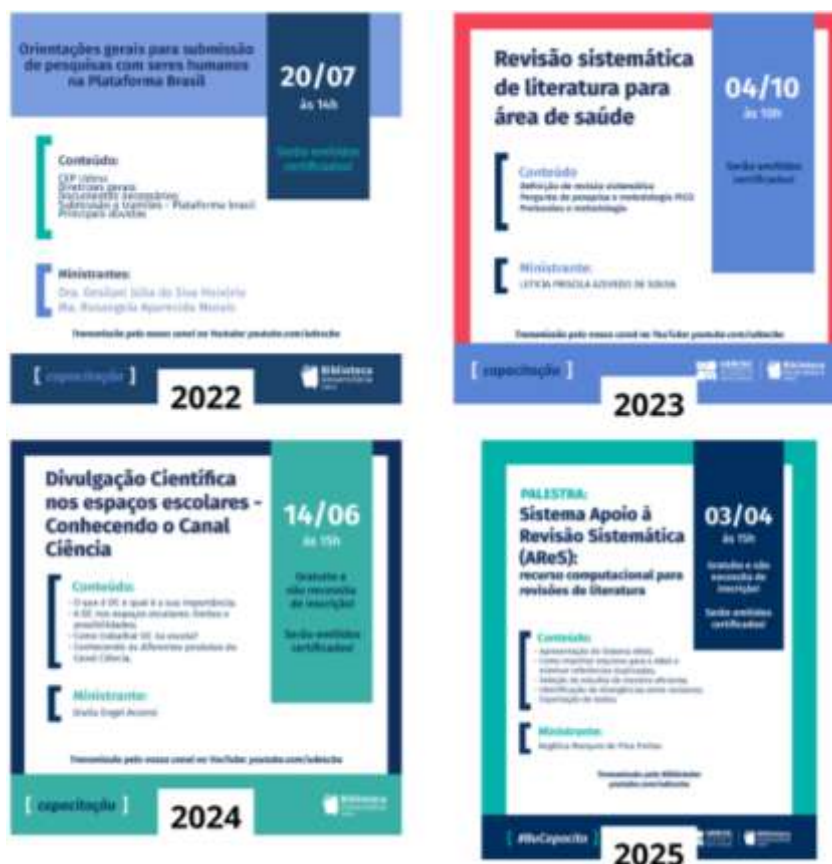
Figura 2 – Imagens de divulgação do Instagram

Fonte: Biblioteca Universitária (2022; 2023; 2024; 2025).