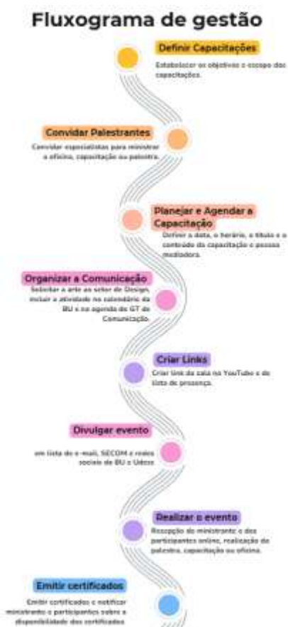
Figura 1 - Sequência de organização de capacitação