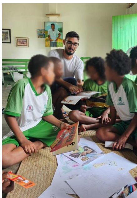
Figura 2 - Oficina de desenho infanto juvenil realizada na comunidade quilombola do Remanso

Ainda analisando as ações e descrições apresentadas por meio do Quadro 1, notou-se que as atividades interativas promovidas nesses espaços favorecem o protagonismo social e informacional dos sujeitos. Conforme Perrotti (2017), o protagonismo não se limita ao acesso ao livro, mas envolve a capacidade de transitar entre diferentes linguagens, interpretar conteúdos e produzir sentidos. Assim, as ações editoriais desenvolvidas pela Eduefs potencializam processos dialógicos e participativos, fortalecendo vínculos sociais e ampliando o impacto cultural da universidade. Para exemplificar essa afirmação, indica-se a Figura 2 abaixo, a qual registra o momento da oficina de desenho voltado à crianças e adolescentes.