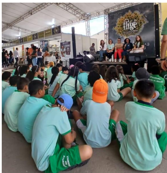
Figura 1 - Contação de histórias na FLIGÊ

Sob a perspectiva dos regimes de informação, González de Gómez (2003) compreende que diferentes atores, políticas e infraestruturas articulam-se para produzir e distribuir informação em redes de poder. Nesse sentido, ao ocupar espaços em festas e festivais literários, a Eduefs contribui para descentralizar a circulação do conhecimento científico, ampliando sua acessibilidade e aproximando a produção acadêmica da sociedade. Desse modo, os registros realizados no instrumento metodológico adotado nesta comunicação que foi o diário de campo, favoreceu a descrição de uma ação, por exemplo, que alcançou um número significativo durante a FLIGÊ que ocorreu no município de Mucugê localizado no território de identidade da Chapada Diamantina no estado da Bahia. Esse registro permitiu identificar como a contação de histórias pode favorecer o incentivo à leitura e à oralidade por meio da ludicidade, como é possível observar na Figura 1 abaixo.