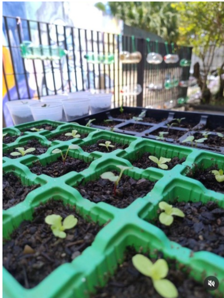
Fotografia 1 – Berçário das mudas de plantas - 1º encontro

Os resultados evidenciam a potência da articulação entre leitura e prática. Do ponto de vista quantitativo, foram confeccionados 33 vasos com garrafas PET, organizados em estruturas verticais. Cada vaso produziu um vegetal, incluindo alface, couve, espinafre, rabanete e coentro.