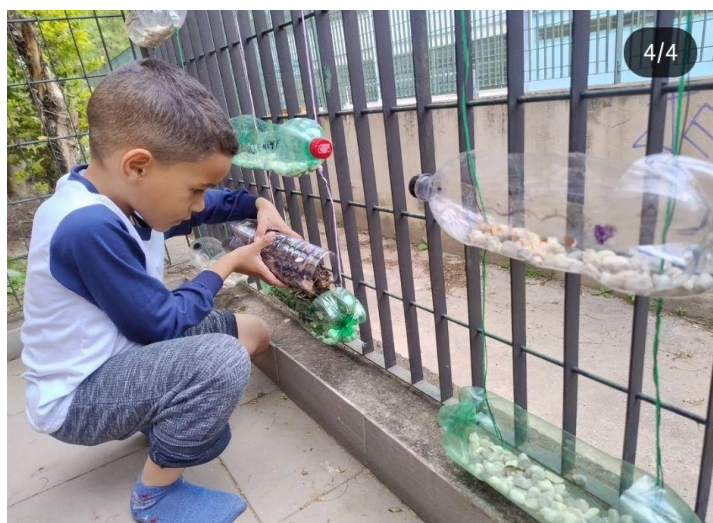
Fotografia 3 – Preparação das garrafas pet com terra

Descrição: Foto do interior da biblioteca, com crianças sentadas em tatames azuis ao centro, com mediador de leitura em pé, segurando um livro, a frente de um quadro branco portátil. Ao fundo, mobiliários e estantes de livros da biblioteca, uma pessoa sentada com um computador à mesa, em ambiente bem iluminado.