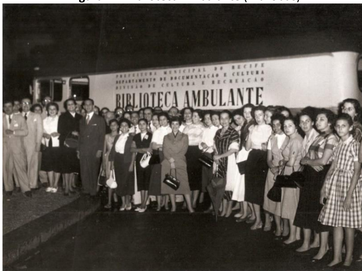
Figura 2 – Biblioteca Ambulante (Bibliobus)