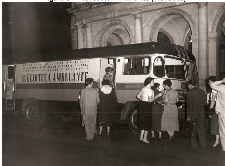
Figura 3 – Biblioteca Ambulante (Bibliobus)