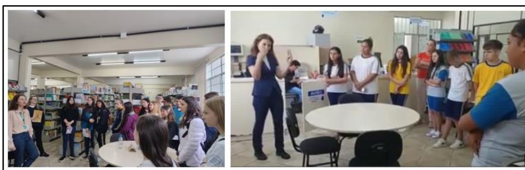
Figura 1: Grupo escolar Dalmo Stafir - Apresentação da biblioteca em LIBRAS 2023/2024.

A comunicação em língua de sinais faz toda a diferença no funcionamento da biblioteca, principalmente no serviço de referência. Usuários com deficiência auditiva passaram a frequentar mais a biblioteca. Como resultado, em 2023, o curso de matemática recebeu uma aluna com deficiência auditiva. A bibliotecária atendeu em língua de sinais, realizando o cadastro da mesma no sistema institucional. Este processo de adaptação, gera autonomia e envolve o discente em um processo de inclusão eficaz. Além dessa aluna, a instituição também tem um professor de LIBRAS que é deficiente auditivo. Figura abaixo demonstra uma apresentação na biblioteca em LIBRAS.