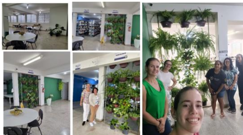
Figura 6: Presença das plantas no ambiente da biblioteca

A presença das plantas no ambiente acadêmico contribui com a prática de educação ambiental, pode proporcionar hábitos mais saudáveis, humanizados e ser um espaço que proporciona bem-estar para os acadêmicos que frequentam esse ambiente. Para a execução desse projeto foi organizada uma parede verde na biblioteca e uma mesa de plantas medicinais.