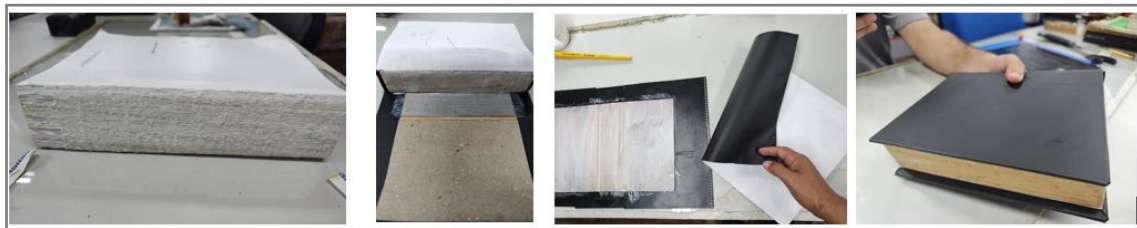
Figura 3: Oficina de pequenos reparos

Dentre as atividades desenvolvidas por eles, a realização de pequenos reparos nos materiais do acervo é uma delas. Após o período, eles passam a conhecer o acervo e a realizar os atendimentos propriamente ditos, eles começam a identificar materiais de que precisam para intervenções a fim de poder circular adequadamente, como demonstra a figura a seguir.