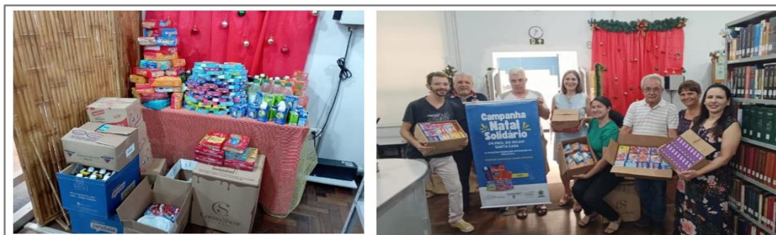
Figura 5: Donativos - Natal Solidário em 2023.

Na segunda quinzena de outubro, dá-se início do projeto com a divulgação em salas de aula, cartazes em locais estratégicos do campus, lembretes com os produtos de arrecadação e também é reforçado através do site da Unespar, banners, pelas redes sociais, como e-mail , Instagram e WhatsApp . Na terceira semana de dezembro faz-se a entrega dos produtos arrecadados para a Casa de Apoio. conforme figura abaixo.