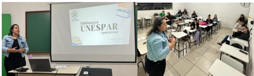
Figura 4 - Curso de Redação e Normalização

Essa iniciativa visa desenvolver competências para que os estudantes possam localizar, avaliar, utilizar e comunicar informações de maneira crítica, organizada e ética, melhorando a qualidade de suas produções científicas. Os encontros semanais permitem explorar estratégias de organização de ideias, estruturação de argumentos e aplicação de normas, melhorando a coerência e a consistência da comunicação escrita, fundamentais para a inserção acadêmica. Também enfatiza a conduta ética em produções acadêmicas, destacando a importância de utilizar citações e referências adequadamente para evitar plágio e promover a integridade intelectual. O feedback positivo dos participantes tem motivado a continuidade e aprimoramento do curso, demonstrando a importância do suporte oferecido pela biblioteca no desenvolvimento das habilidades de produção e expressão do conhecimento. Confira figura abaixo.