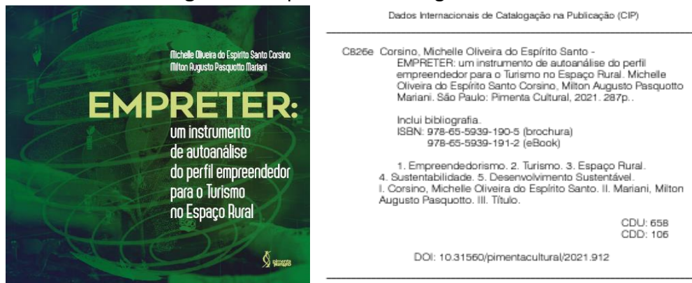
Figura 2 – Capa e ficha catalográfica de um e-book