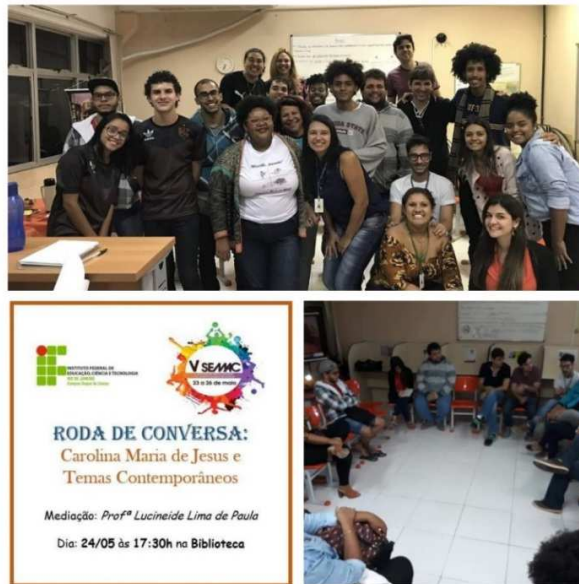
Figura 4 - Roda de conversa