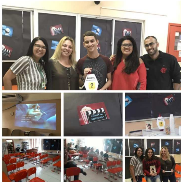
Figura 5 - Cinebook