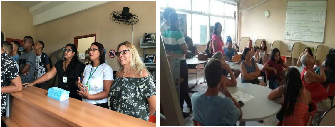
Figura 2 e 3 – Acolhimento e ambientação dos novos alunos