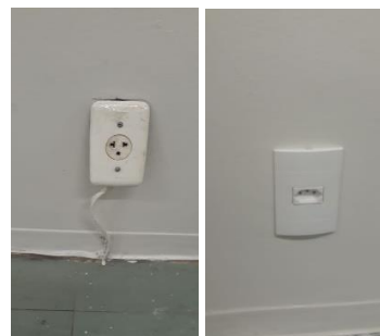
Imagens 17 e 18- Antes e depois da instalação elétrica

Há ainda a parceria com a Cooperativa de Catadores de Materiais Recicláveis Reciclo, do Recanto das Emas, a qual tem recolhido todo o resíduo reciclável gerado durante o período de reforma na sede.