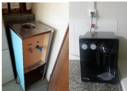
Imagem 15 e 16- Antes e depois do filtro