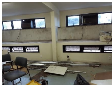
Imagem 8- Ar condicionado antigo

A ABDF além de oferecer o uso do espaço, ainda contribui com a divulgação do Santa Biblioteconomia nas redes sociais da Associação.