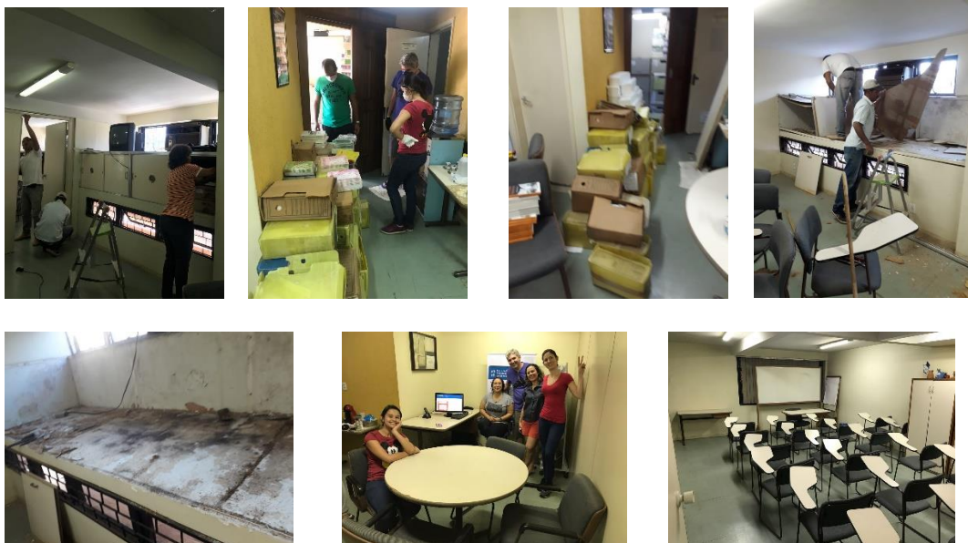
Imagens 1 a 7- Limpeza e organização da Sede da ABDF

Para a organização da sede a ABDF tem contado com a parceria de seus associados, os quais ajudaram na limpeza e mudança, conforme fotos a seguir: