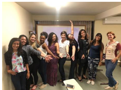
Imagem 10 – Curso Santa Biblioteconomia