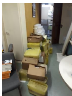
Imagem 12- Antes da pintura

Houve ainda a parceria com a empresa InnovaGestão 2 que presta serviços de consultoria na área de informação, onde a sala da ABDF recebeu nova pintura de acordo com as solicitações feitas pela Associação a empresa. Em contrapartida a ABDF ofereceu a utilização da sala para os cursos oferecidos pela InnovaGestão e ainda a divulgação da empresa nas redes sociais e em eventos promovidos pela ABDF ou em parcerias.