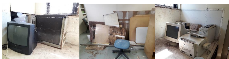
Imagens 19 a 21- Materiais recolhidos pela Cooperativa Reciclo

Há ainda a parceria com a Cooperativa de Catadores de Materiais Recicláveis Reciclo, do Recanto das Emas, a qual tem recolhido todo o resíduo reciclável gerado durante o período de reforma na sede.