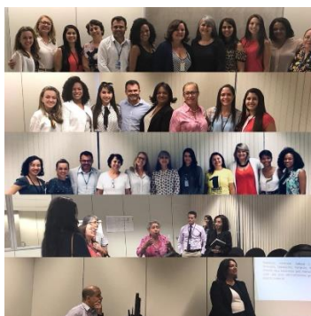
Imagem 22- Grupo de Informação e Documentação Jurídica- GIDJ

Os associados têm auxiliado na retomada de produtos da ABDF, como a Revista Eletrônica da ABDF, o oferecimento de cursos complementares à formação, a manutenção do site , a criação dos grupos de trabalho entre outras atividades que tem fortalecido a Associação e criado o sentimento de pertencimento aos seus membros.