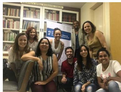
Imagem 11 – Curso Organização de Bibliotecas para Visita do MEC

Houve ainda a parceria com a empresa InnovaGestão 2 que presta serviços de consultoria na área de informação, onde a sala da ABDF recebeu nova pintura de acordo com as solicitações feitas pela Associação a empresa. Em contrapartida a ABDF ofereceu a utilização da sala para os cursos oferecidos pela InnovaGestão e ainda a divulgação da empresa nas redes sociais e em eventos promovidos pela ABDF ou em parcerias.