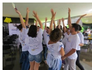
Imagens 23 a 25- BiblioFest 2018

As parcerias buscam otimizar recursos financeiros, contribuir com a sustentabilidade, propiciar o atendimento as propostas feitas pela gestão 2018-2020 e principalmente fortalecer a ABDF no sentido de manter a sua sede, memória, história e atuação junto aos profissionais do DF.