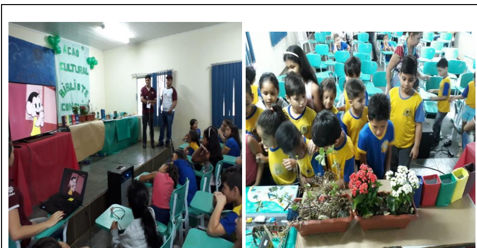
Figura 2 - Palestras e distribuição de vasos.

A intenção dessa atividade foi conscientizar sobre a importância da preservação dos rios e de doenças que podem ser desenvolvidas através do consumo e contato com águas poluídas. Foi trabalhada roda de leitura na biblioteca e em seguida a realização de dinâmicas envolvendo a elaboração de desenhos e pinturas e, posteriormente, a turma do terceiro ano do ensino fundamental da escola I, fez a apresentação de seus desenhos aos coleguinhas.