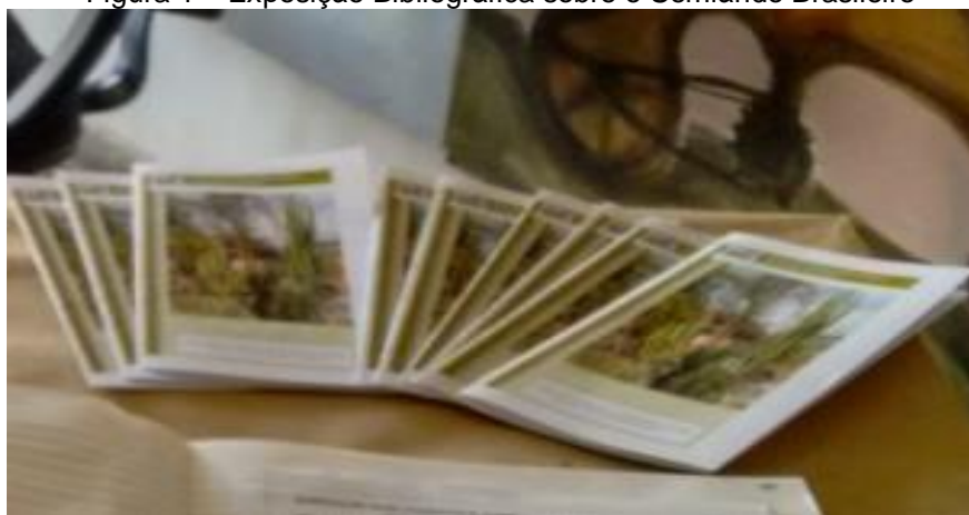
Figura 1 – Exposição Bibliográfica sobre o Semiárido Brasileiro

O segundo passo foi levantar as bases de dados, disponíveis no Sistema de Bibliotecas (SISBI), que abordam o semiárido, e outras fontes de pesquisa sobre o tema. Essas informações estão sendo divulgadas através do folheto Exposição Bibliográfica sobre o Semiárido Brasileiro , conforme apresentado na figura 1.