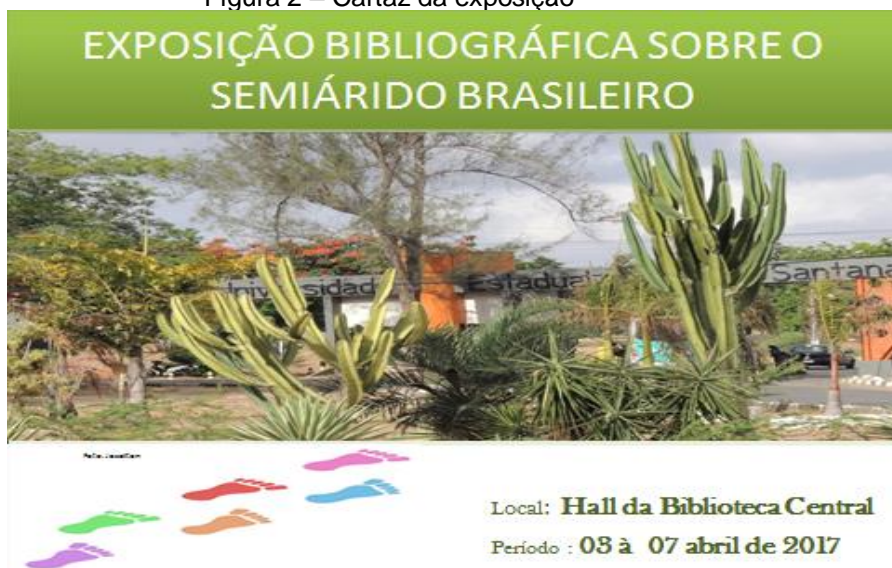
Figura 2 – Cartaz da exposição

A exposição foi realizada em abril de 2017 com o título Exposição bibliográfica sobre o semiárido (figura2), agrupando fontes primarias disponíveis no acervo da Biblioteca Central Julieta Carteado (BCJC), administradora do SISBI-UEFS, com o objetivo de difundir o conhecimento disponível no acervo da BCJC e incentivar a pesquisa sobre o tema.