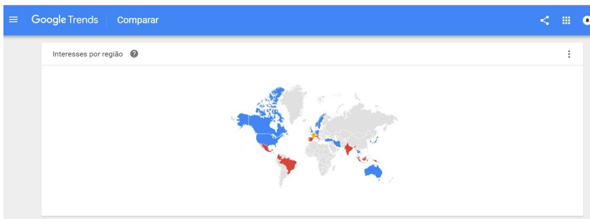
Figura 2 – Cobertura mundial dos gerenciadores de referências.