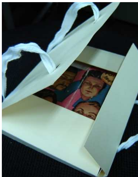
Figura 1: Caixa de Papel Alcalino

Caixas ou envelopes de papel alcalino são recomendados visando a preservação dos materiais, pois asseguram proteção contra os agentes degradantes e guarda adequada aos suportes frágeis, estabilizando os processos de degradação.