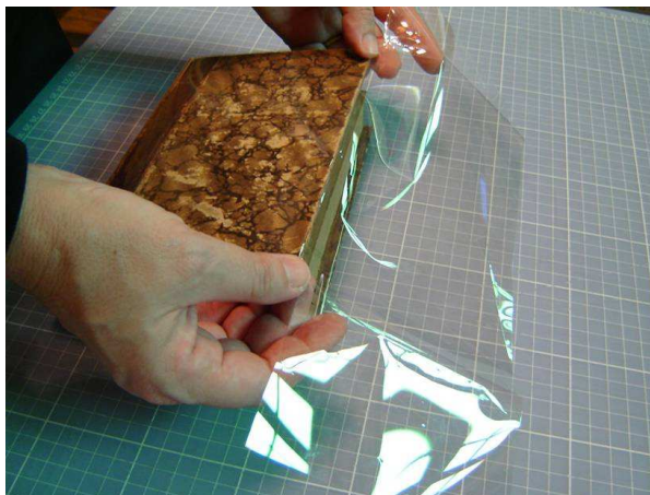
Figura 2: Confeção de Jaqueta de Poliéster