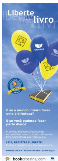
Figura 3 – Banner