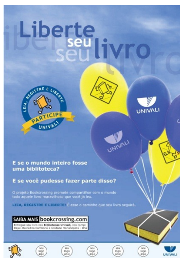
Figura 4 – Cartaz