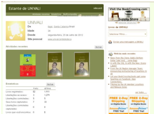
Figura 9 – Tela do Bookcrossing onde foram cadastrados os livros