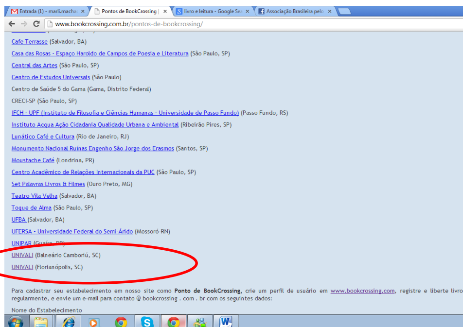
Figura 11 – Tela do site do Bookcrossing Brasil onde estão listados os pontos oficiais

Com a campanha em andamento, os pontos de coleta montados e a inserção dos dados das obras acontecendo no site do bookcrossing, foram enviados dados e fotos dos pontos de coletas da Instituição aos responsáveis pelo Bookcrossing Brasil para que fosse feito o cadastro da UNIVALI como ponto oficial de coleta do projeto em Santa Catarina, conforme pode ser visualizado na figura 11.