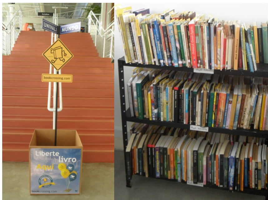
Figura 8 – Ponto de Coleta Biblioteca Balneário Camboriú