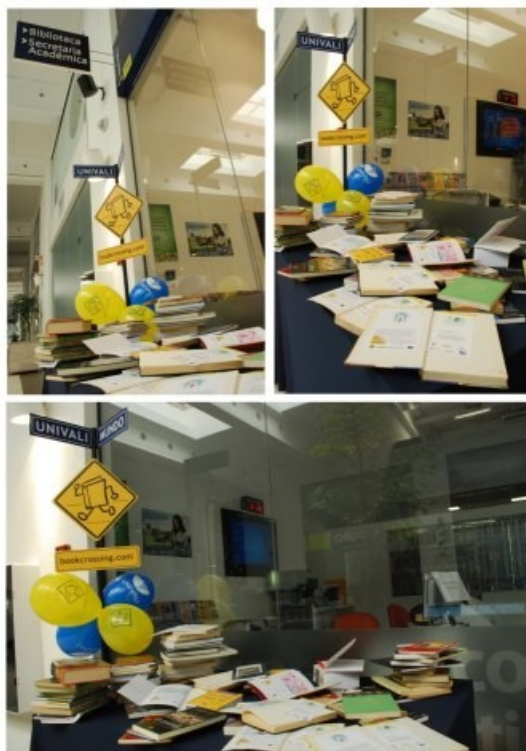
Figura 7 – Ponto de Coleta Biblioteca Unidade Ilha