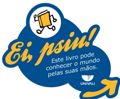
Figura 5 – Selo Ei psiu