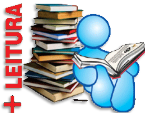
Figura 1 – Logo do blog +Leitura BCo