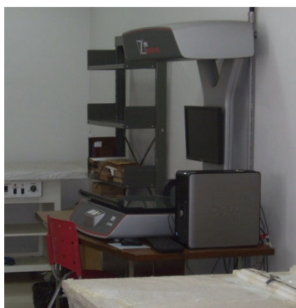
Figura 1 – Scanner planetário do Laboratório Eterna.

Há também o uso de métodos para a correta digitalização das obras, com o uso de scanner planetário e aplicativos para tratamento de imagem, permitindo uma qualidade profissional na geração e tratamento dessa informação. As imagens originais, ou as derivadas, de menor definição, serão utilizadas para diversos fins (como divulgação, ilustração de catálogo impresso ou inclusão no OPAC). A digitalização é feita no scanner planetário do Laboratório Eterna da Biblioteca Central (fig. 1). No Laboratório, ocorrerão os procedimentos de análise física, conservação preventiva e restauração das obras.