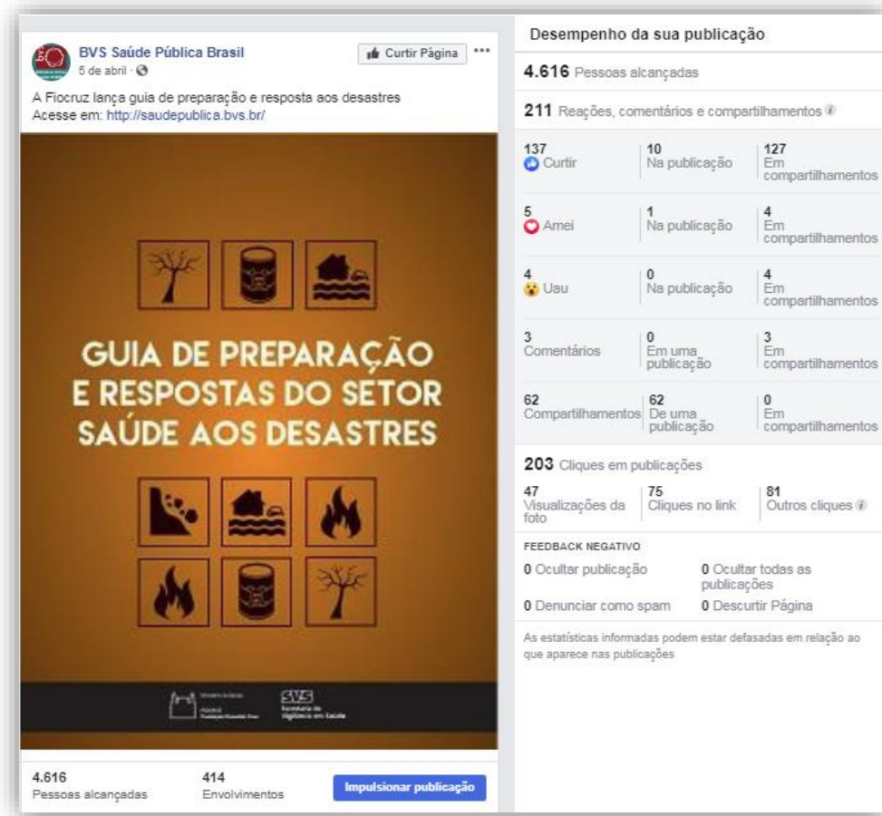
Figura 2 – Publicação com o maior alcance de usuários na BVS-SP Brasil